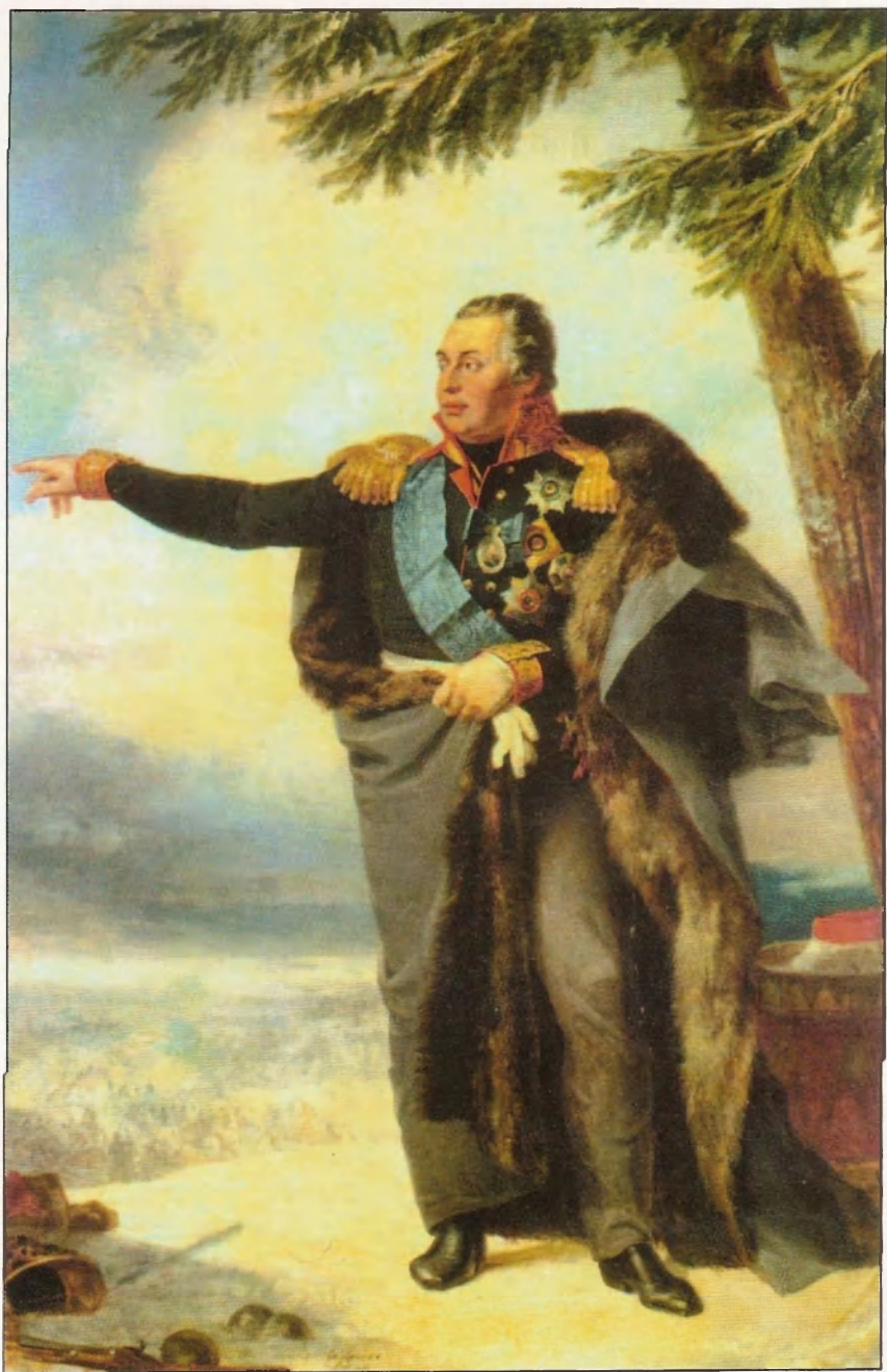
Генерал-фельдмаршал Светлейший князь Михаил Илларионович Голенищев-Кутузов-Смоленский (1747—1813)