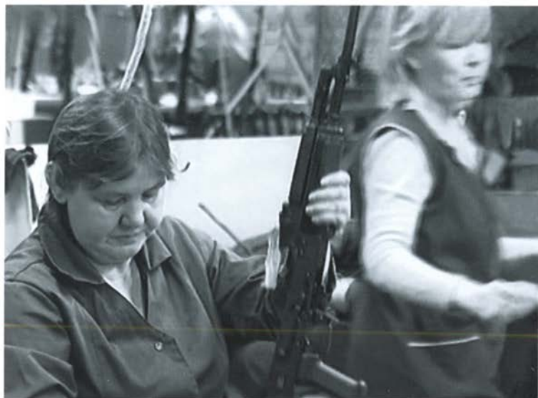
В одном из цехов Ижевского машиностроительного завода

Во время встречи с заместителем председателя Правительства РФ Д. О. Рогозиным