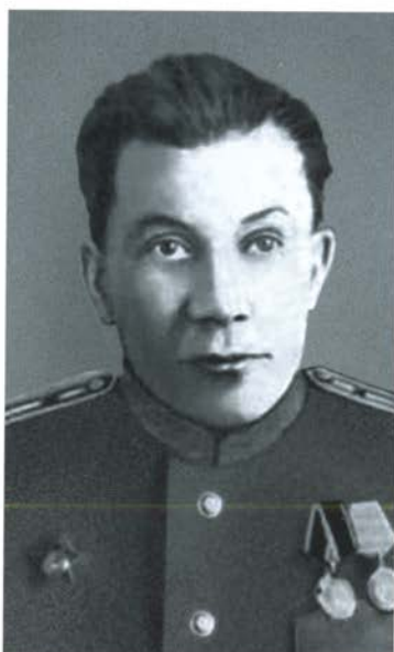
Конструктор-оружейник А. И. Судаев

Пистолет-пулемет системы Г. С. Шпагина образца 1941 года (вверху). Пистолет-пулемет системы А. И. Судаева образца 1943 года (внизу)