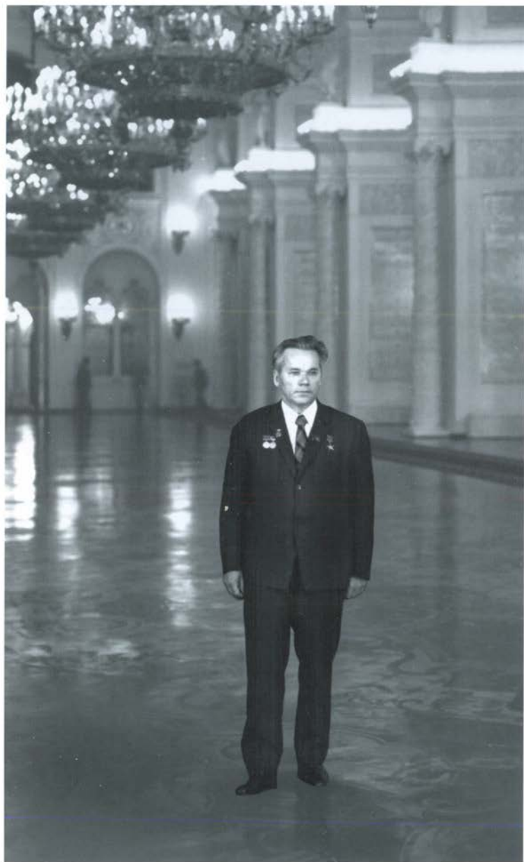
Депутат Верховного Совета СССР. Июль 1973 г.