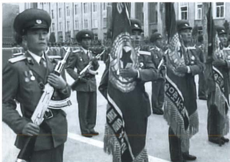
АК — самое распространенное в мире оружие