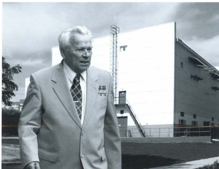
У подстанции «Калашников» в Ижевске. 2011 г.