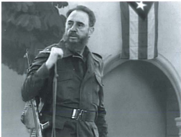
Фидель Кастро Рус с автоматом Калашникова