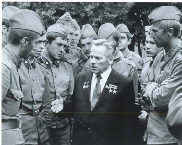
В батальоне связи в Пospелихе Алтайского края. 1983 г.