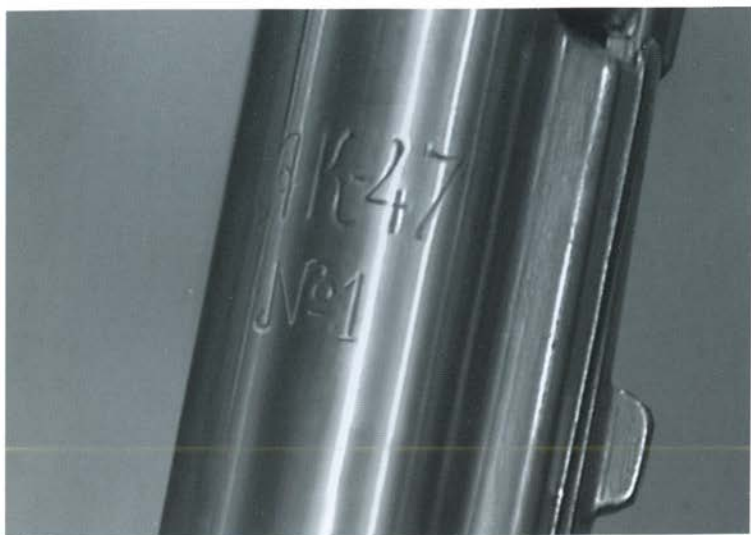
AK-47 № 1 из первой серийной партии