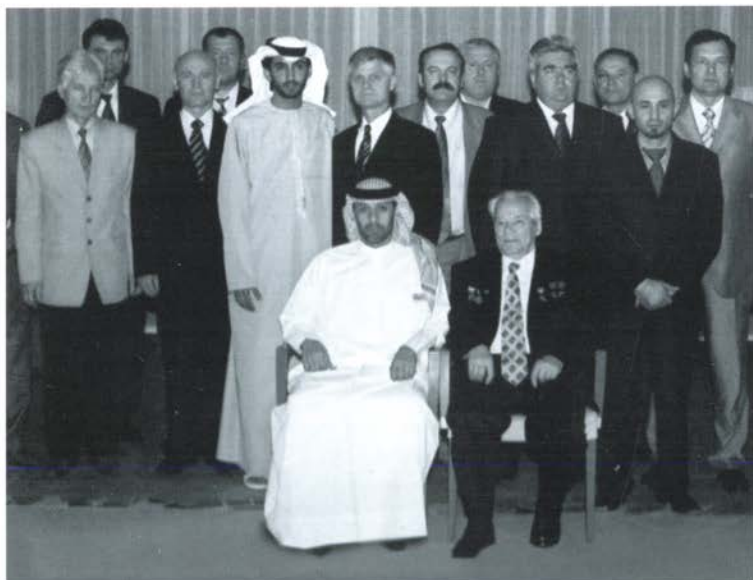
На встрече с представителем МВД ОАЭ — Сейф Обейд Халифа Аль-Хили. Абу-Даби, 2005 г.