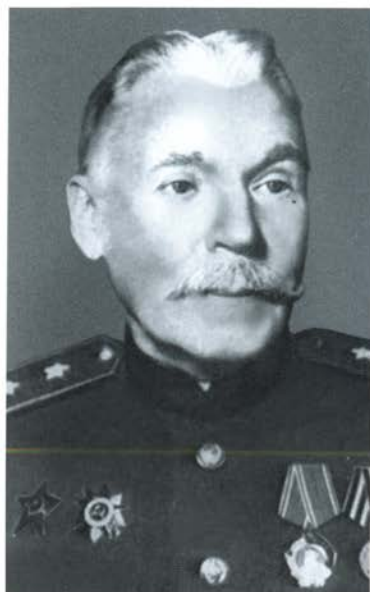
Создатель первого отечественного автомата генерал-майор В. Г. Федоров