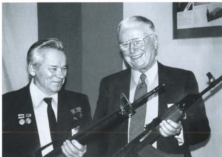
Встреча с Юджином Стоунером, автором американской винтовки М 16. США, январь 1993 г.