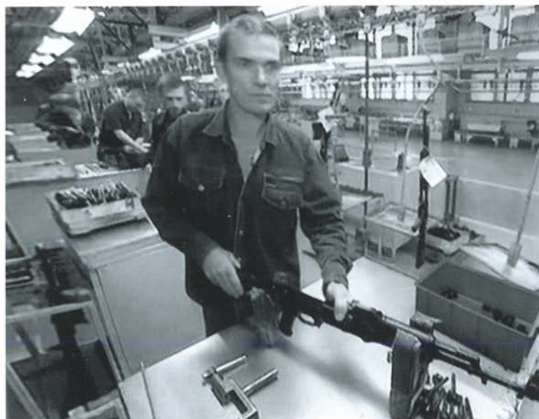
Главный конвейер сборки автоматов Калашникова