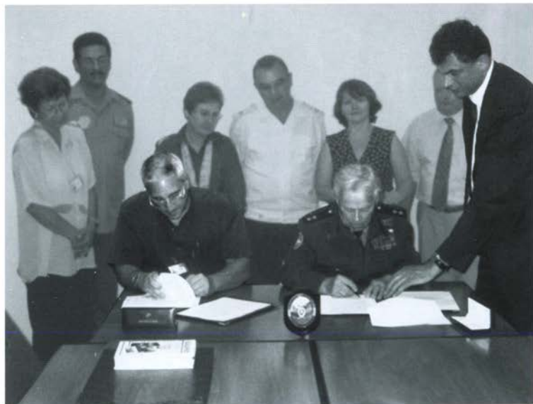
М. Т. Калашников подписывает контракт на поставку Кубе автоматов АК-103. Гавана, апрель 2006 г.