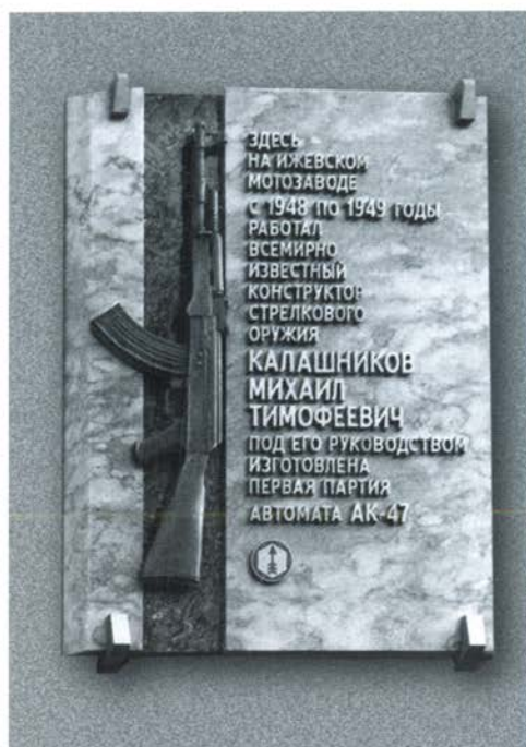
Мемориальная доска, установленная на одном из зданий Ижевского мотозавода