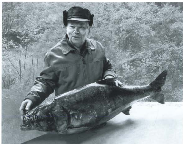
Подарок от друзей. Август 2008 г.