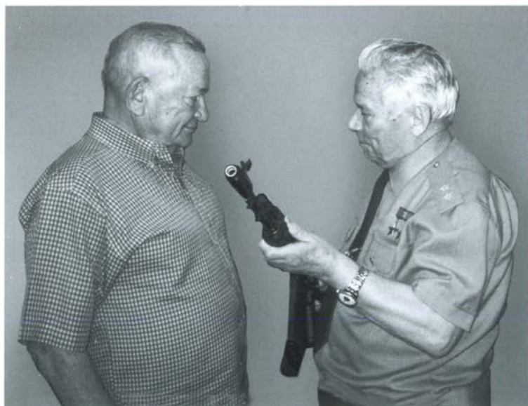
Вручение подарочного образца АК-74 команданте Революции, Герою Республики Куба Гильермо Гарсиа Фриасу. Гавана, апрель 2006 г.