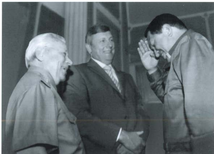
С президентом Венесуэлы полковником Уго Чавесом. Каракас, июнь 2006 г.