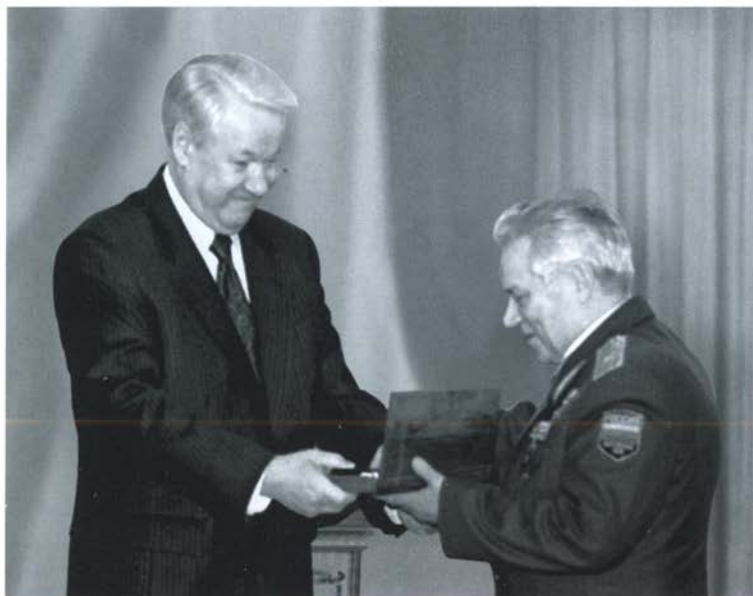
Подарок от Б. Н. Ельцина — почетное именное оружие. Москва, Кремль, 1997 г.