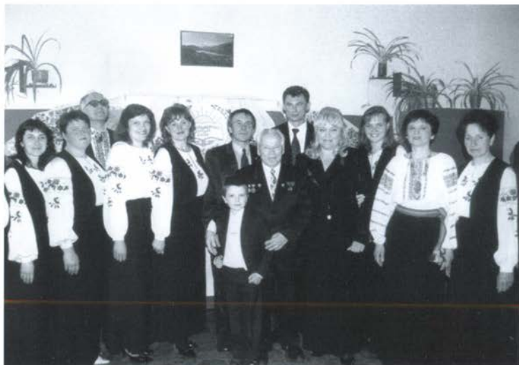
Посещение средней школы села Великие Будища Диканьского района Полтавской области. Май 2005 г.