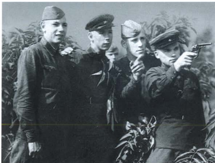
На учебных стрельбах в танковой школе (г. Стрый). 1939 г.