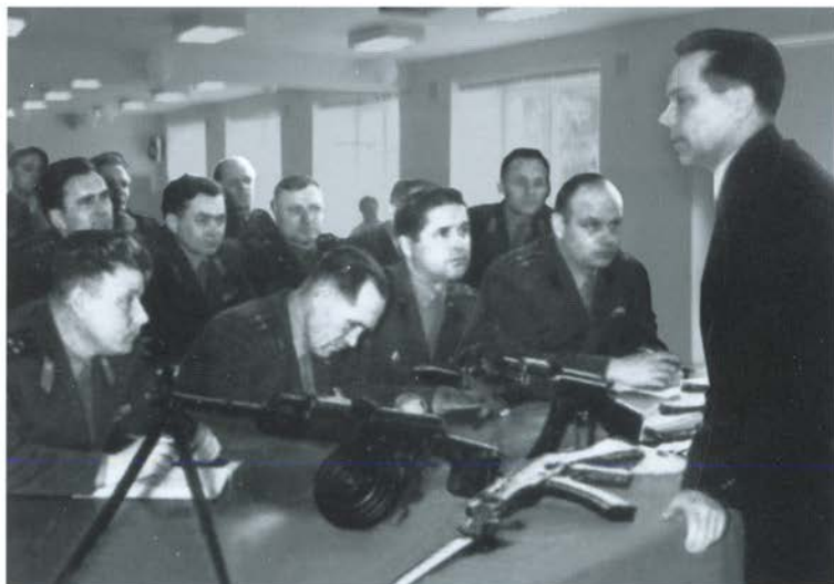
Встреча с конструкторами на Высших офицерских курсах «Выстрел»