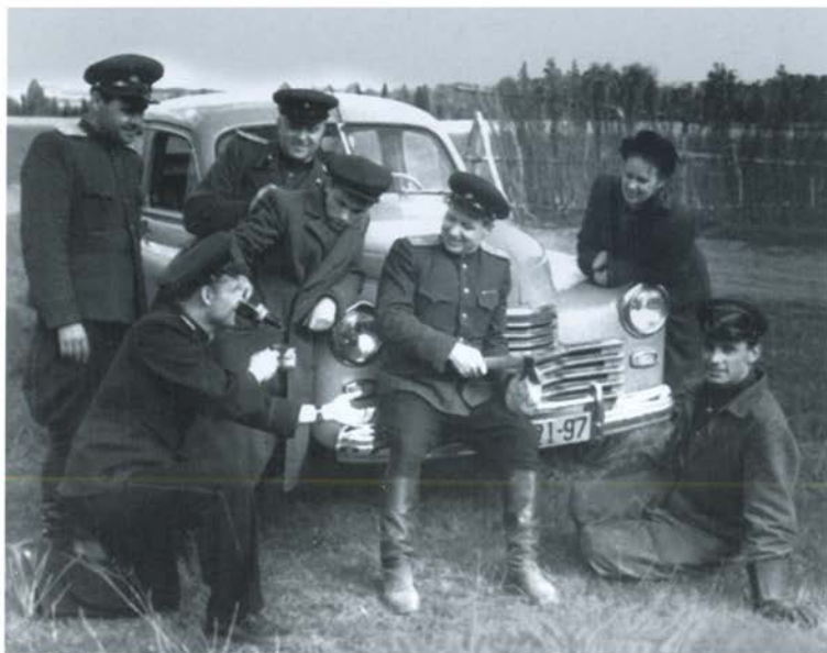
С друзьями возле автомобиля «Победа», приобретенного на Сталинскую премию. Начало 1950-х гг.