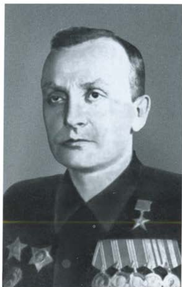
Конструктор-оружейник Г. С. Шпагин