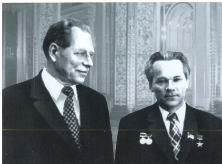
С министром оборонной промышленности Д. Ф. Устиновым