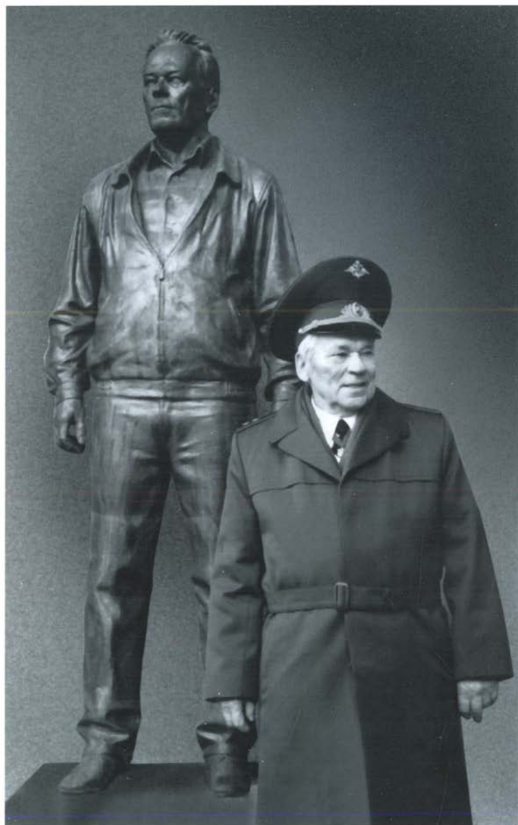
Возле скульптуры у Музея имени М. Т. Калашникова в Ижевске