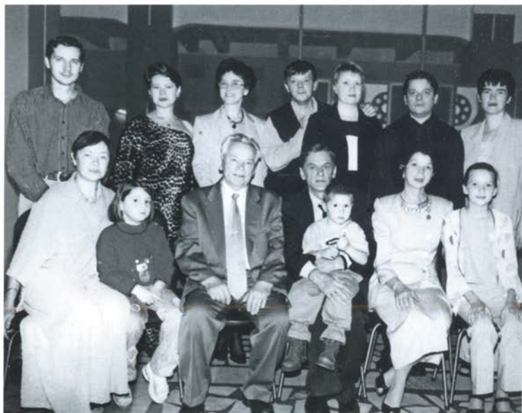
Дружная семья в сборе. Ижевск, 2002 г.