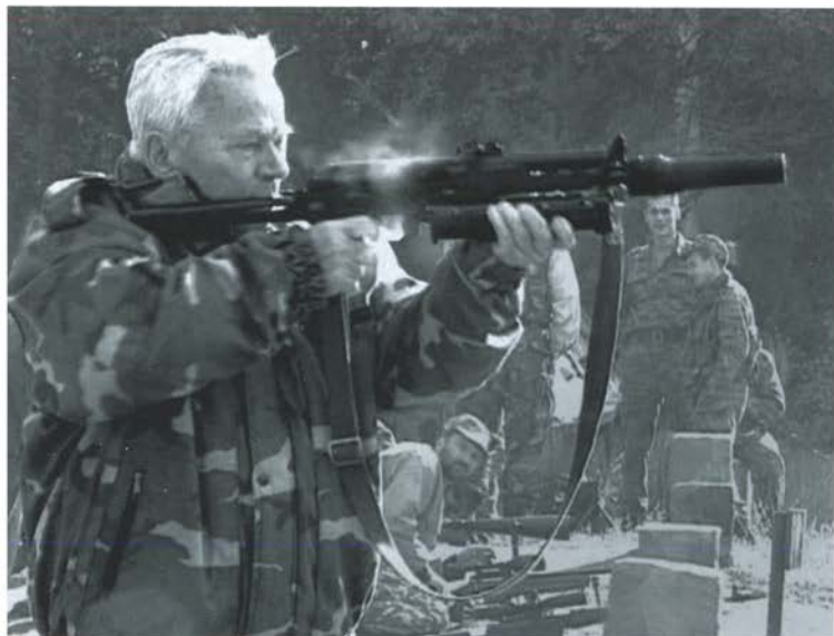
На огневом рубеже. Ижевск, 2007 г.