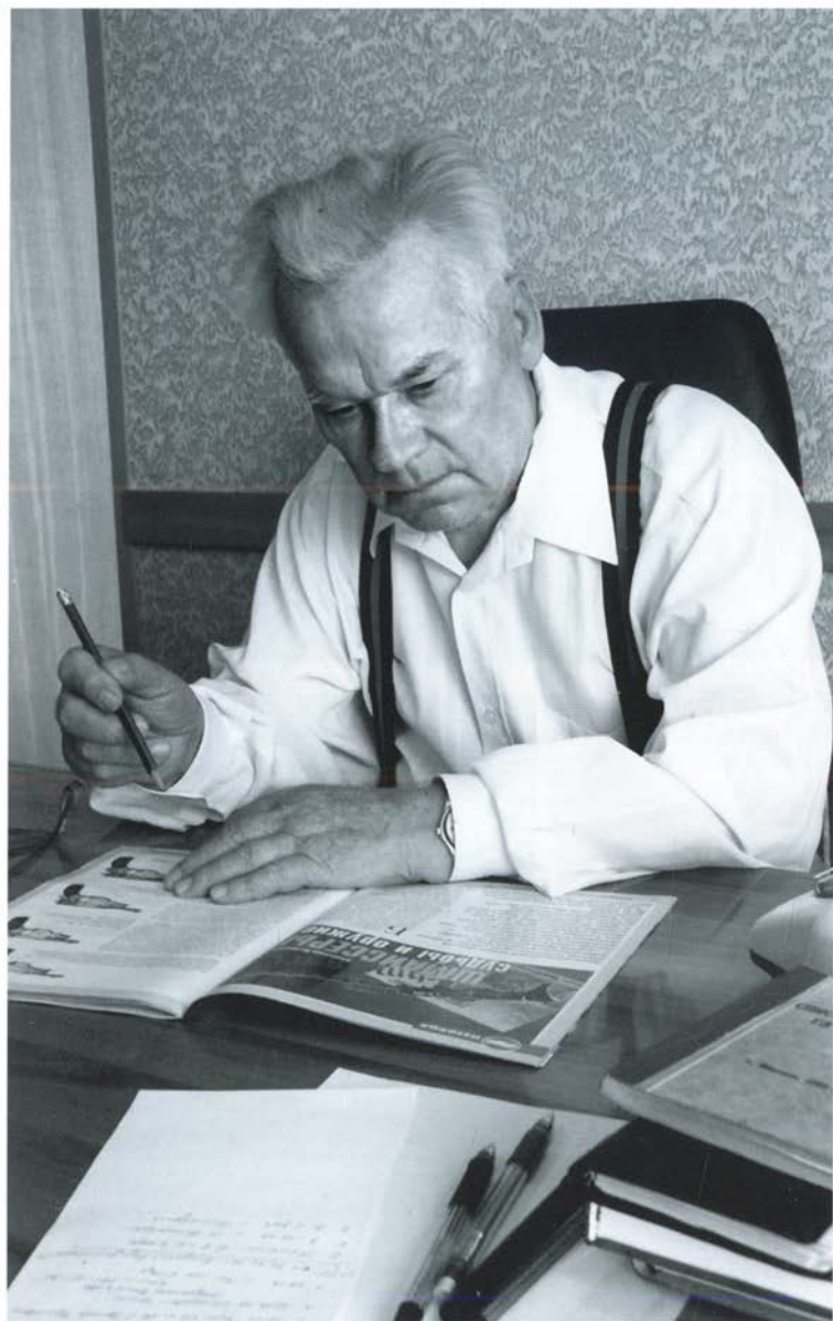
Работа над очередной книгой «Все нужное — просто». 2009 г.