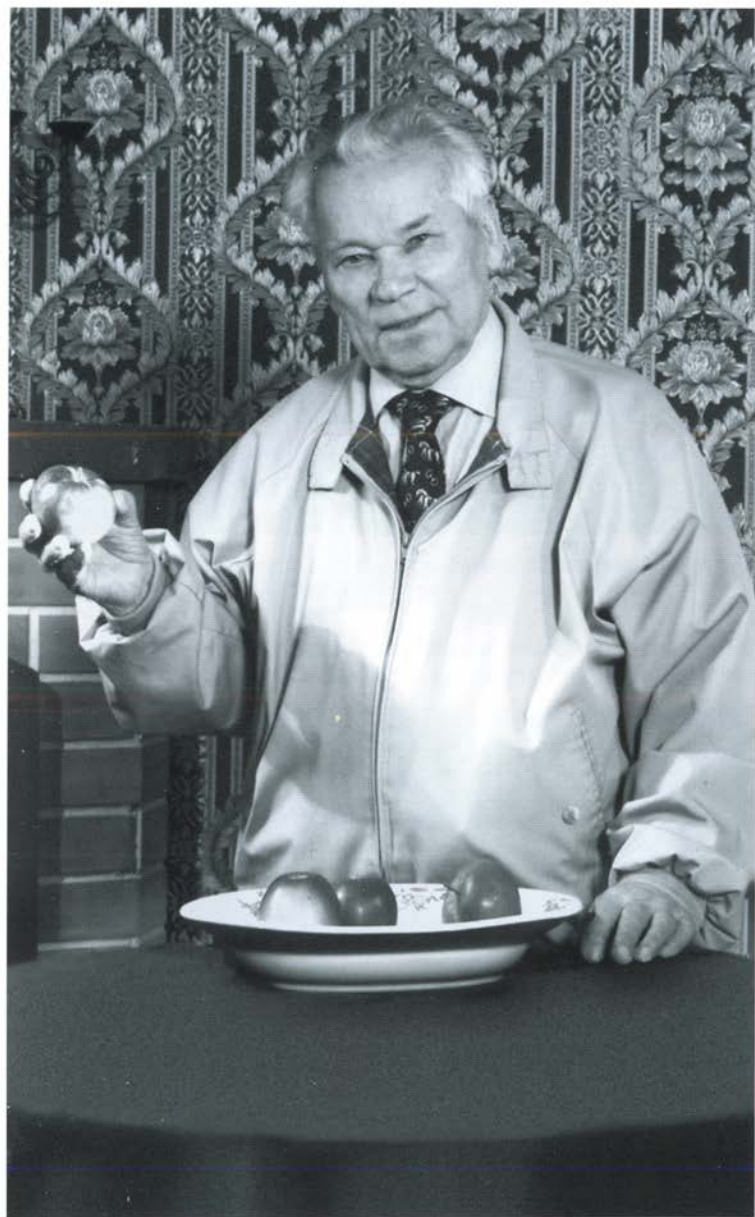
Яблоки от белорусских саженцев, подаренных А. Г. Лукашенко. Октябрь 2005 г.