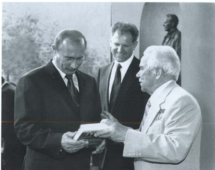
Встреча с В. В. Путиным в Ижевске. 21 июня 2006 г.

Патриарх Московский и всея Руси Алексий II вручает Калашникову награду Русской православной церкви. Август 2007 г.